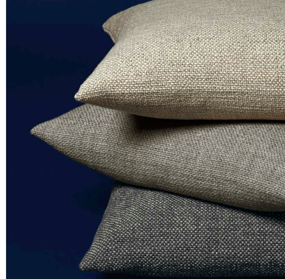
CUSCINI AUCKLAND AUCKLAND PILLOWS