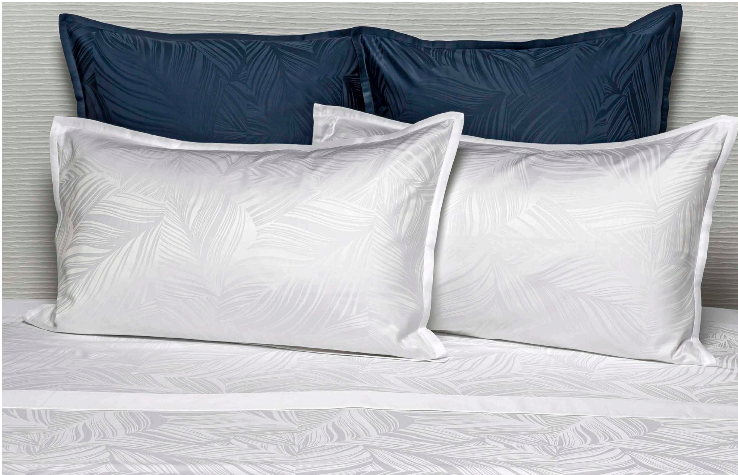
COMPLETO LETTO HAMBURY SHEET SET HAMBURY