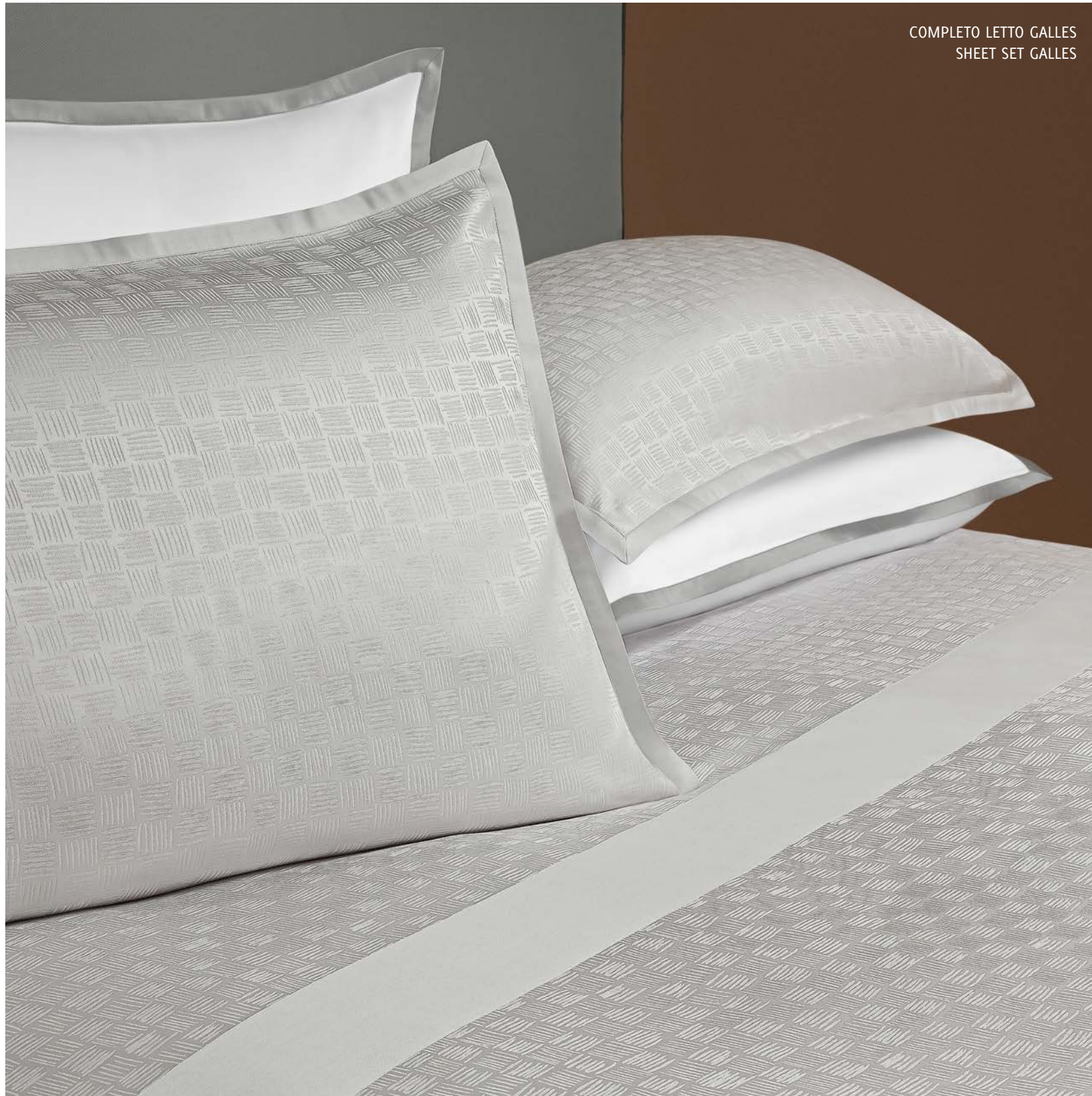
COMPLETO LETTO GALLES SHEET SET GALLES