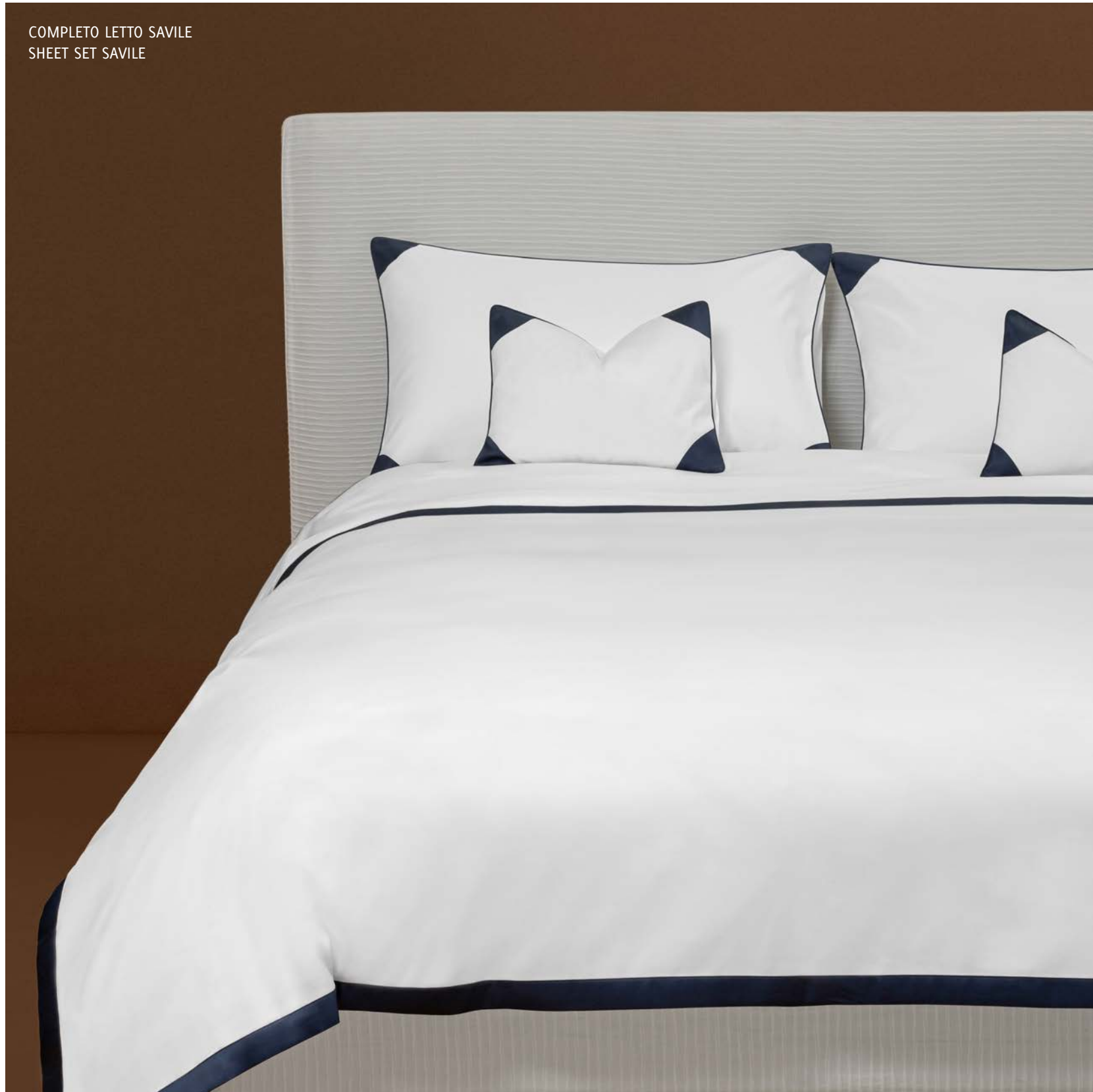
COMPLETO LETTO SAVILE SHEET SET SAVILE