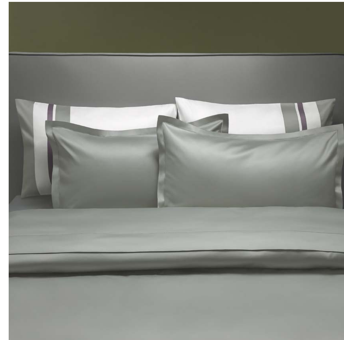
COMPLETO LETTO RASO/BELLAGIO SHEET RASO/BELLAGIO