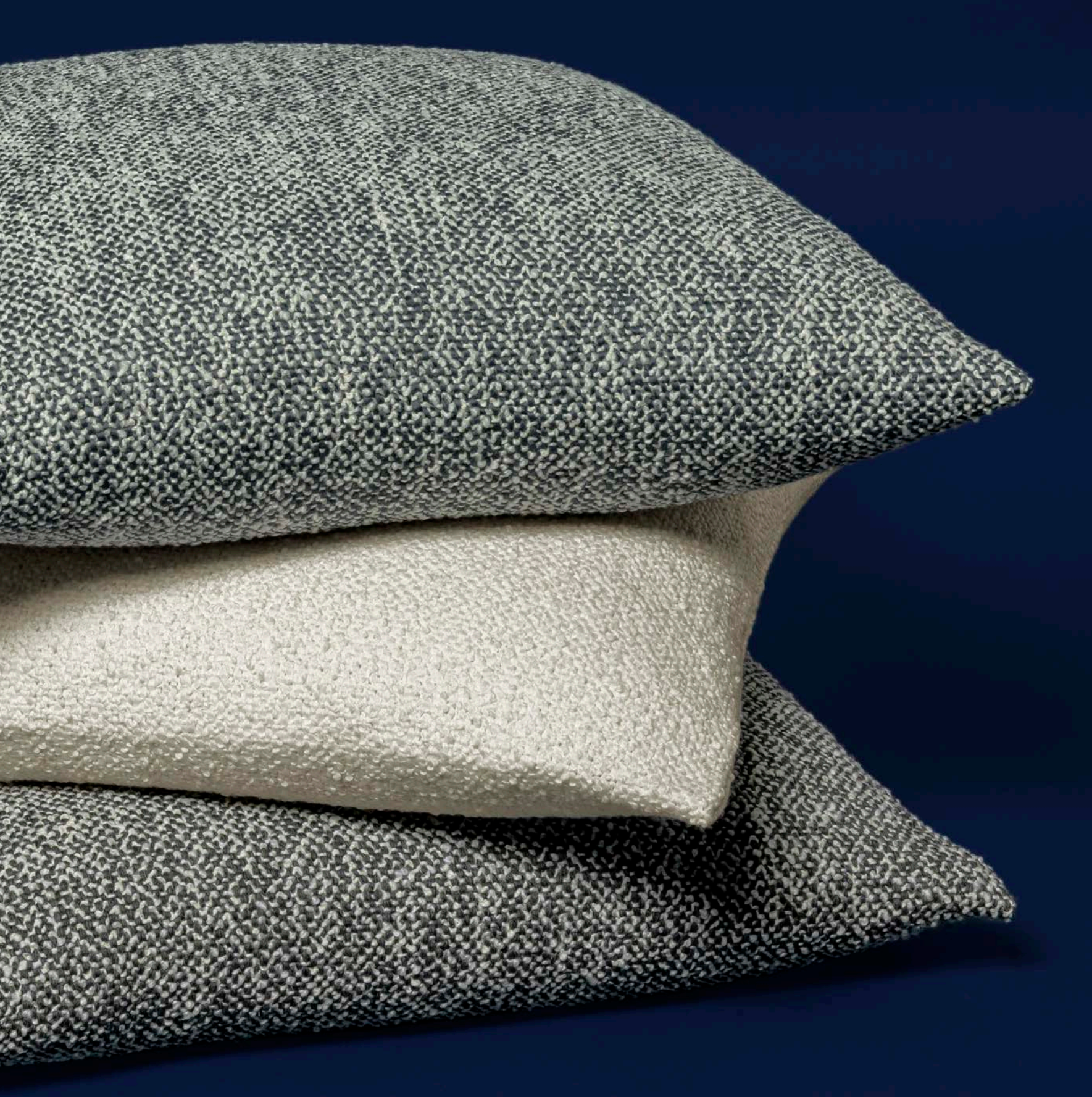
CUSCINI PERTH PERTH PILLOWS