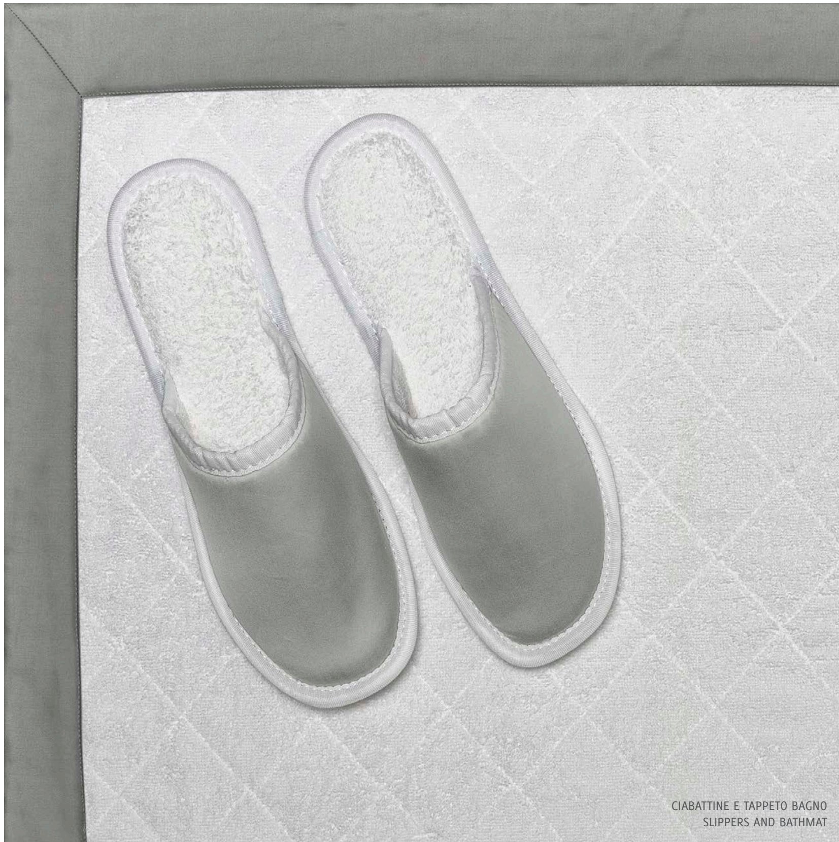
CIABATTINE E TAPPETO BAGNO SLIPPERS AND BATHMAT