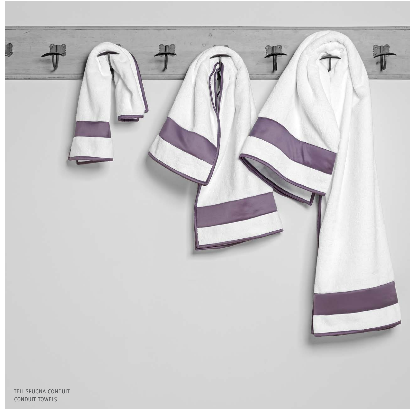
TELI SPUGNA CONDUIT CONDUIT TOWELS