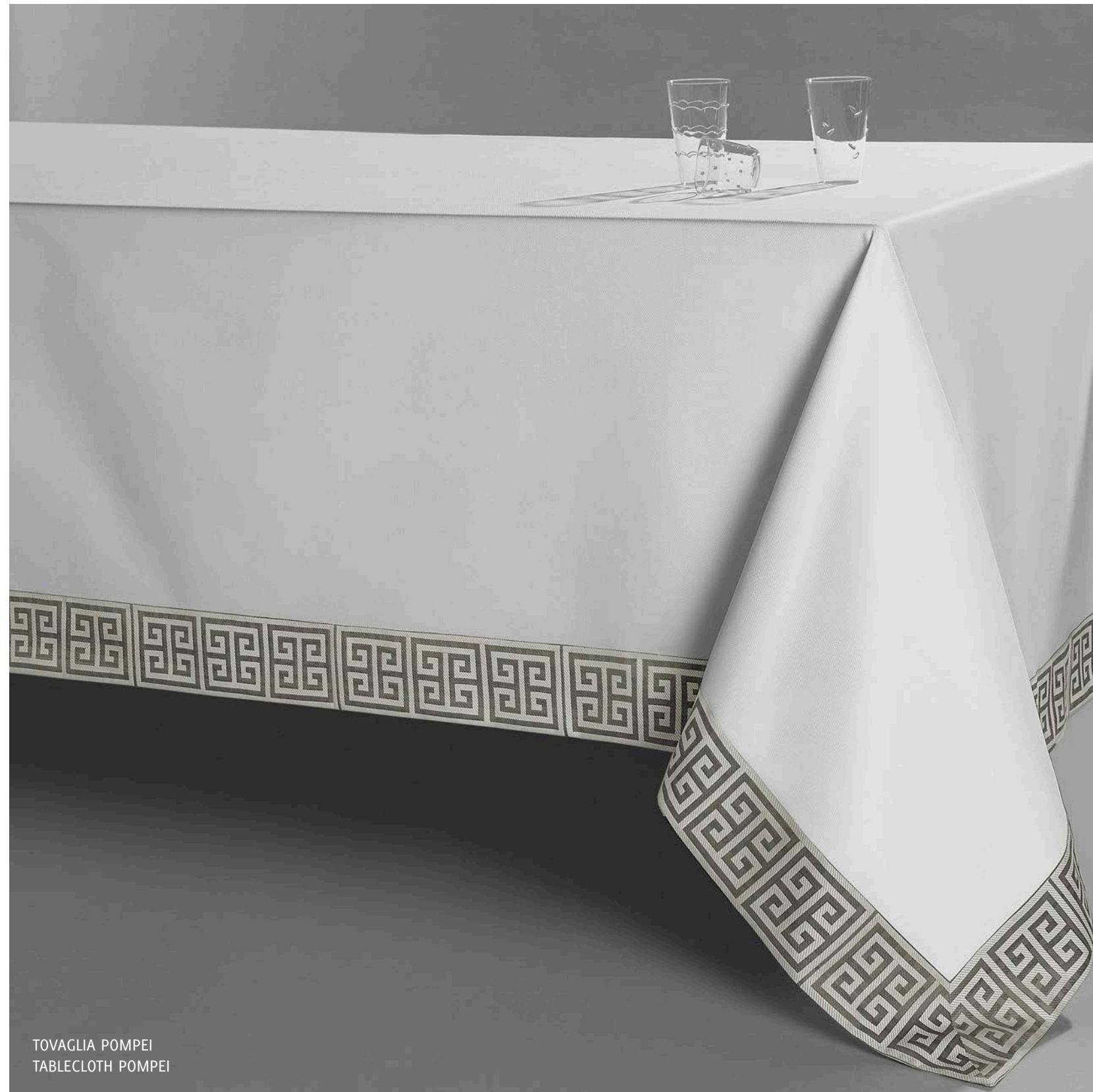
TOVAGLIA POMPEI TABLECLOTH POMPEI