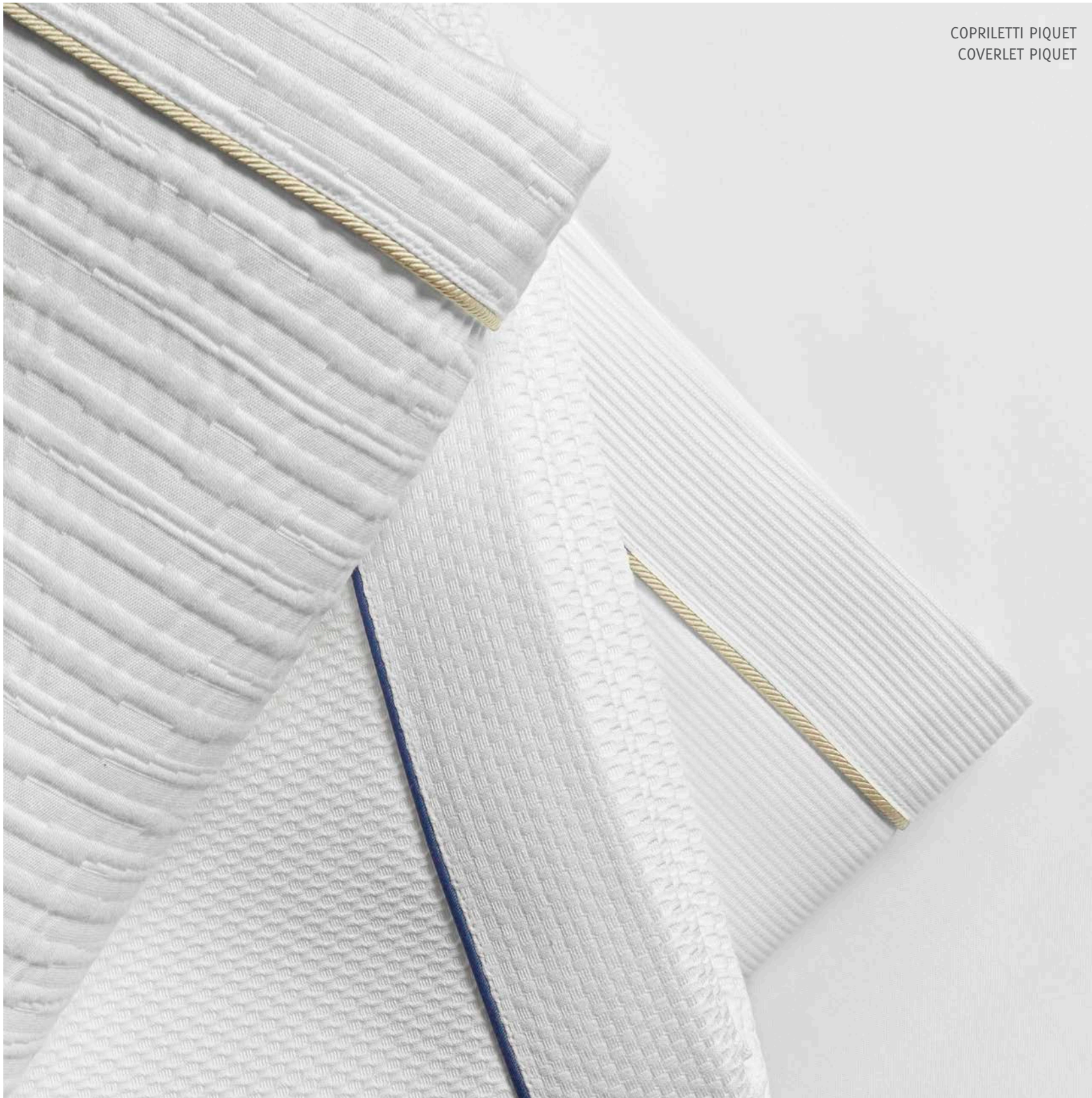
COPRILETTI PIQUET COVERLET PIQUET