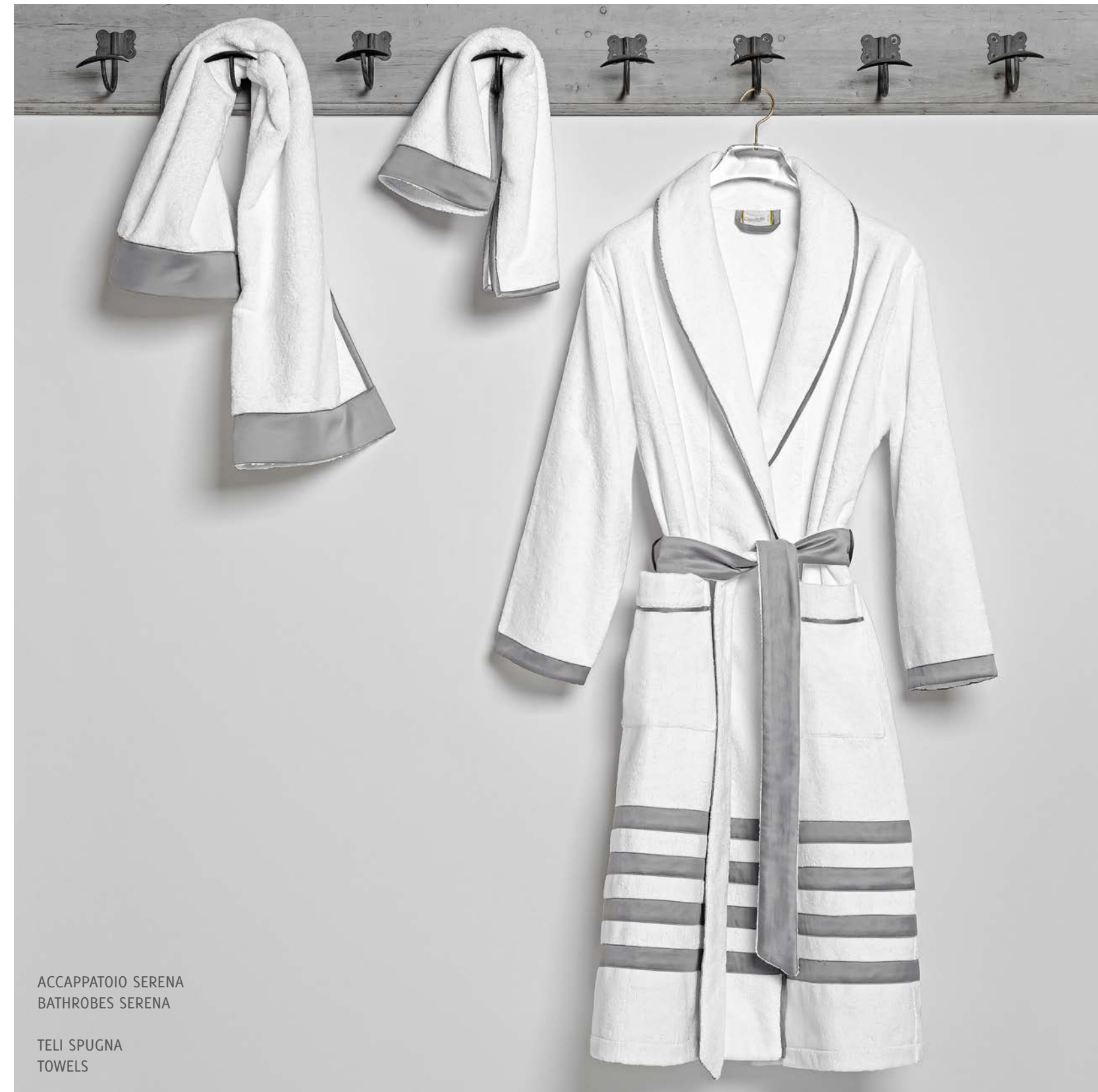
ACCAPPATOIO SERENA BATHROBES SERENA