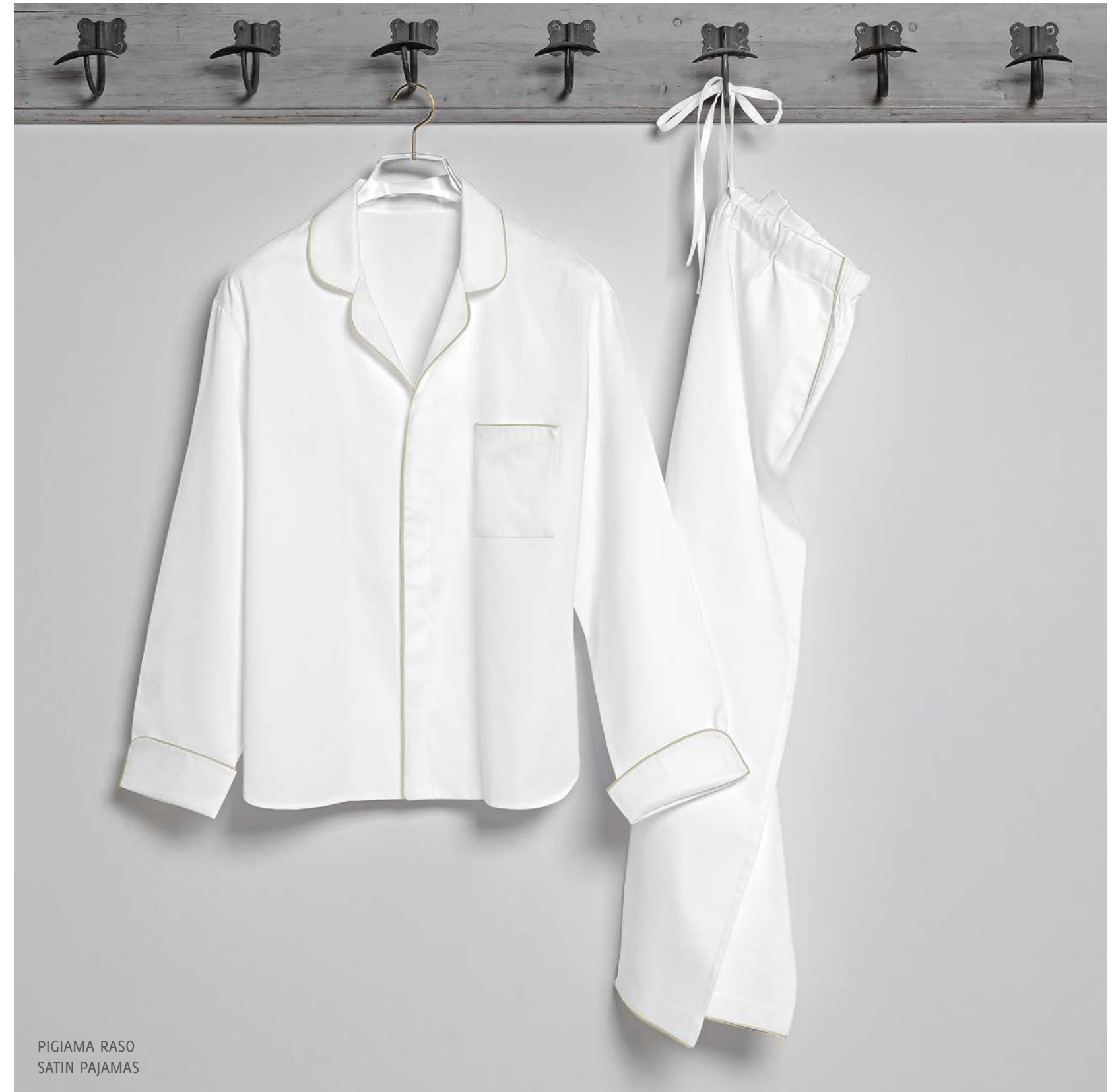
PIGIAMA RASO SATIN PAJAMAS

IN A WARM, PERFUMED ATMOSPHERE, WE ARE WRAPPED AND DRIED BY TAILORED BATHROBES, HAND-CUT AND HAND-SEWN LIKE ELEGANT DRESSES.