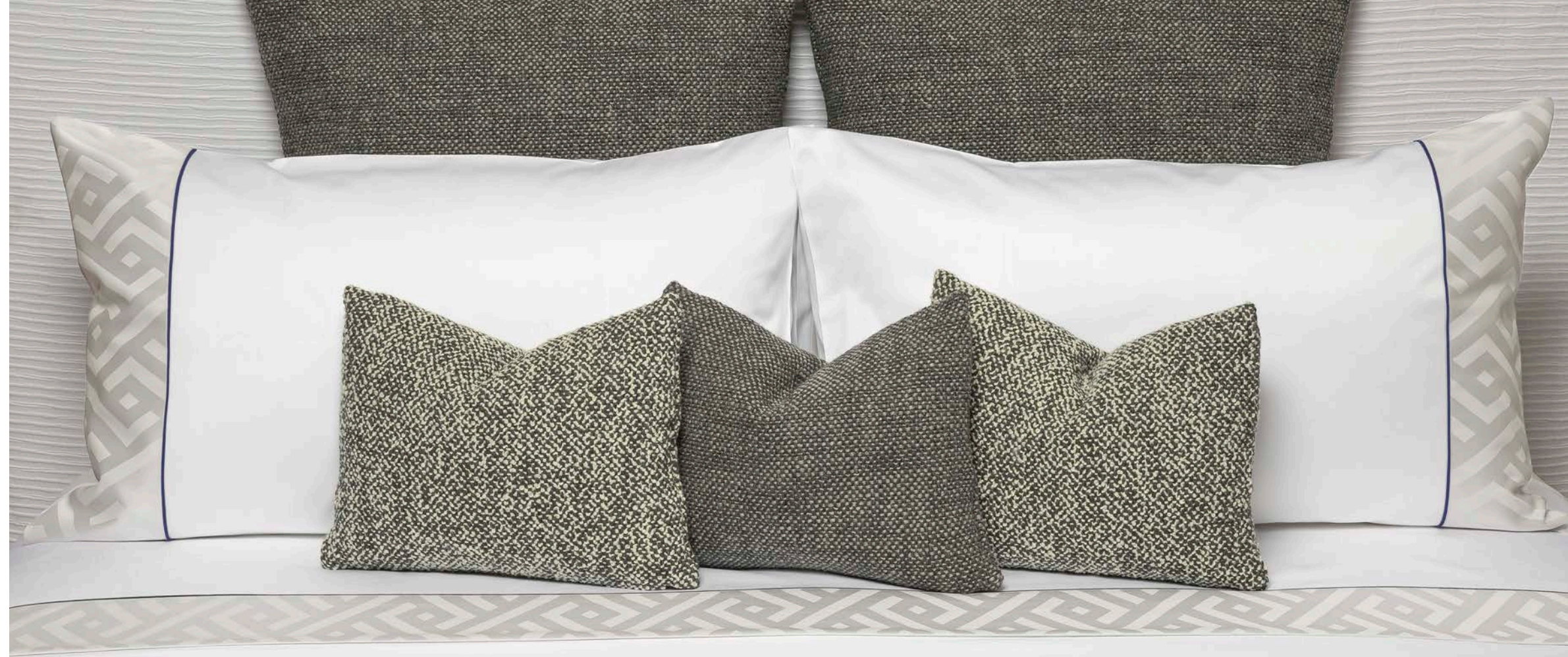
COMPLETO LETTO CAPRERA/ALLEY SHEET SET CAPRERA/ALLEY