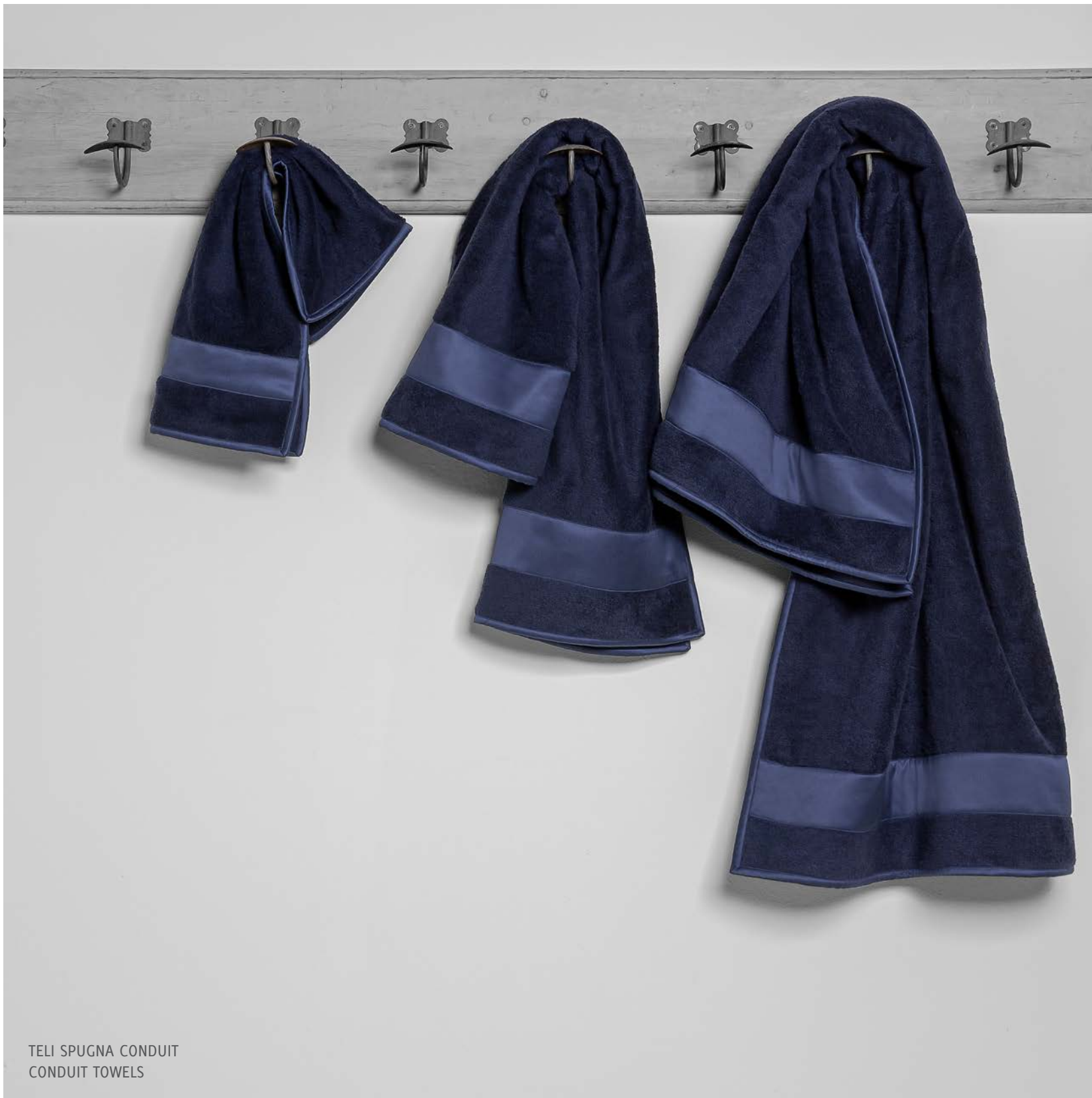
TELI SPUGNA CONDUIT CONDUIT TOWELS