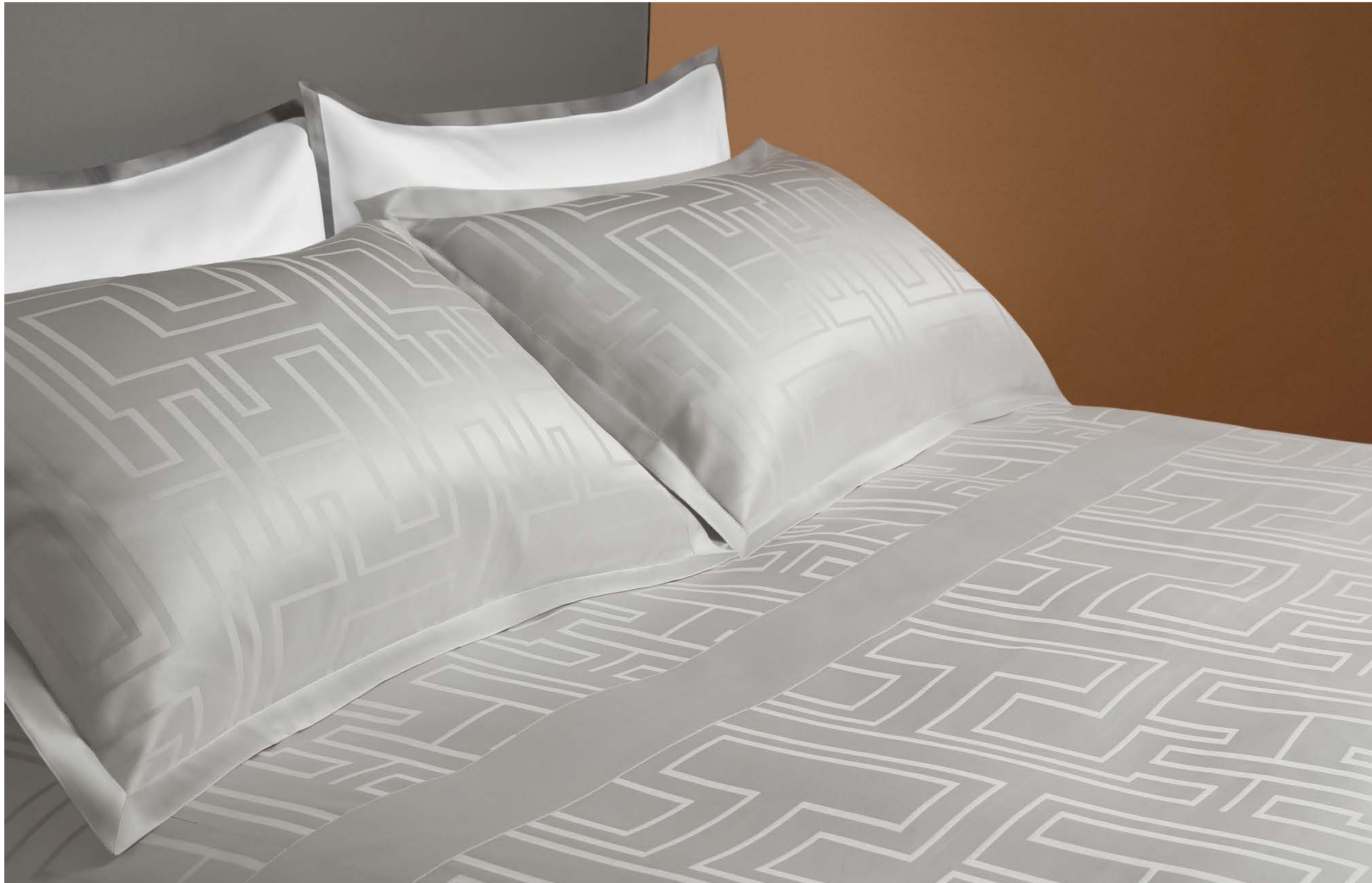
COMPLETO LETTO ARIANNA SHEET SET ARIANNA