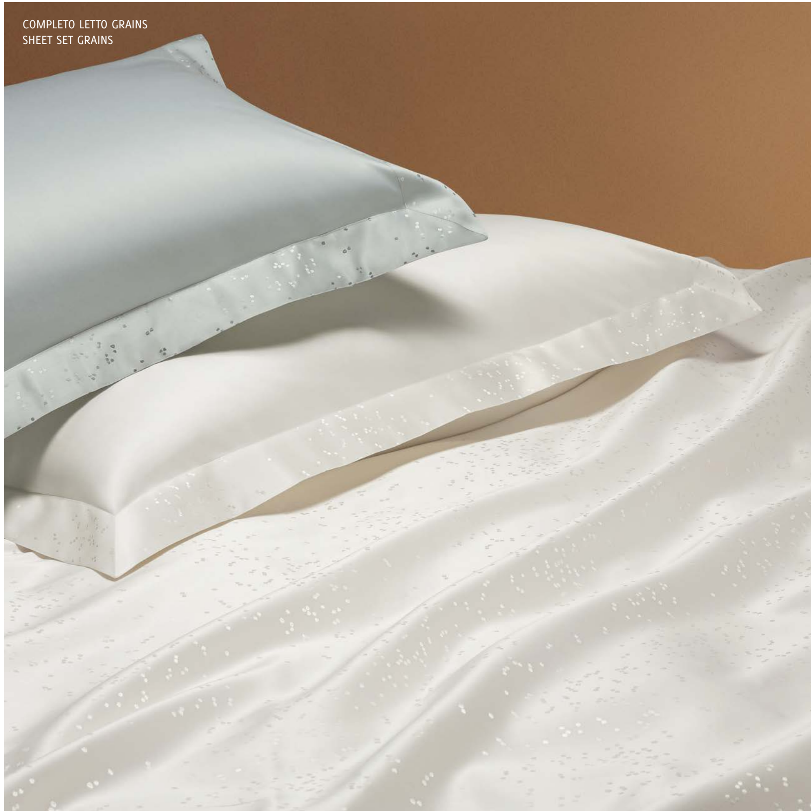
COMPLETO LETTO GRAINS SHEET SET GRAINS