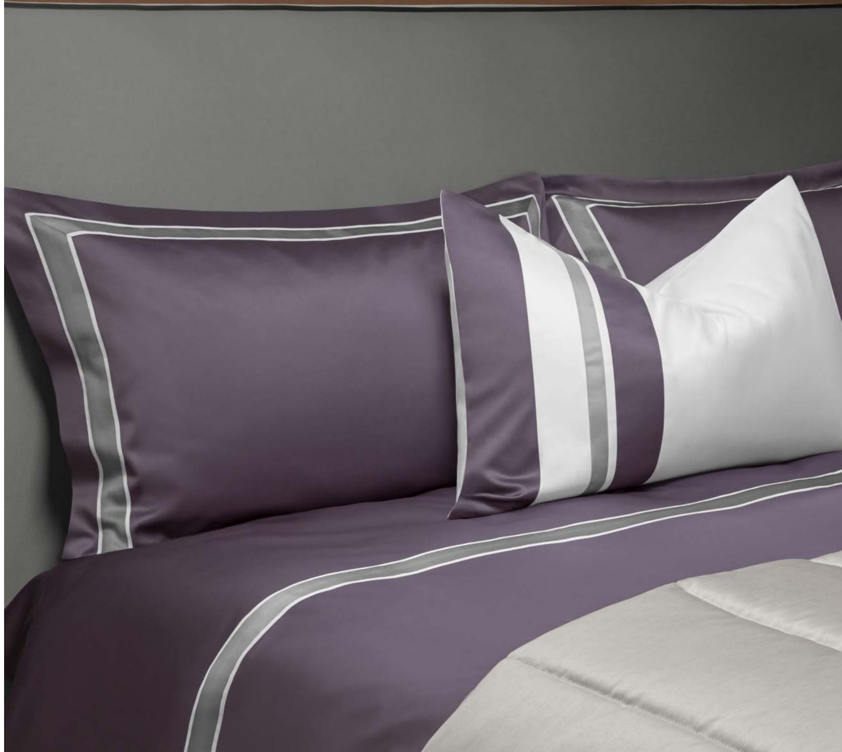
COMPLETO LETTO KENSIGTON SHEET SET KENSIGTON