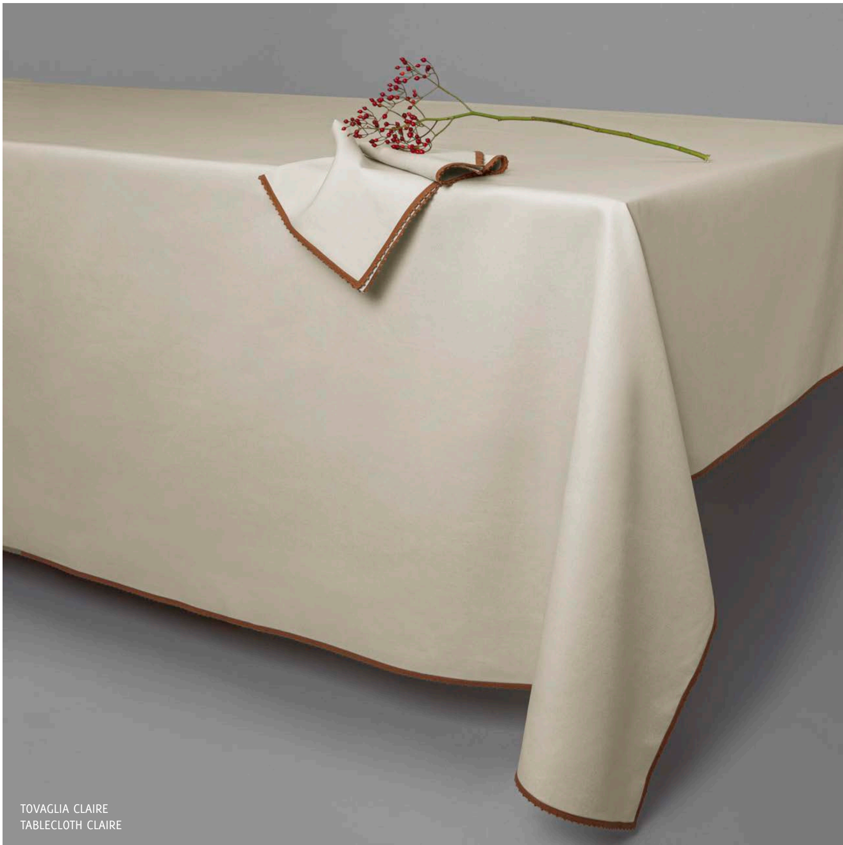
TOVAGLIA CLAIRE TABLECLOTH CLAIRE